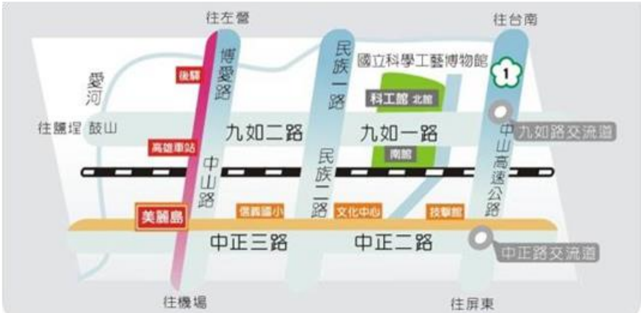
科工館館區平面圖